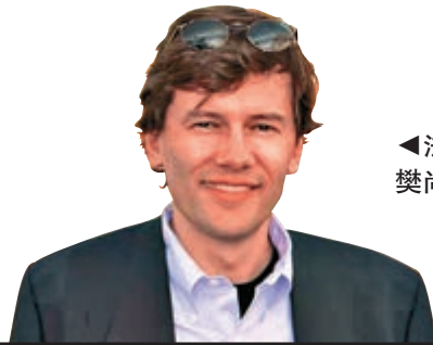
法國投資銀行家樊尚·普珀

普珀稱，英國脫歐後，巴黎可能成爲國際金融業的首選，但法國的改革仍在進行中。巴黎、法蘭克福、阿姆斯特丹和比利時很可能共同承擔歐洲金融中心的職責。目前，在英國有數千名金融機構的員工爲歐盟和國際市場服務，硬脫歐將會對這些員工產生不利影響，他們可能面臨裁員或派遣。英國和其他國家金融業的改革將是艱難且耗時的，其中一個問題可能是其他國家無法短時間內吸納大量的外國人才。普珀說，「我在英國一直都很開心，看到這些親密的兄弟決定不再作爲歐盟的一員我心都碎了。但我相信英國是一個偉大的國家，它擁有偉大的人民，不是每個人都想要脫歐。我不明白他們最終如何陷入到這樣的困境，但你也必須尊重這個國家的規則。」